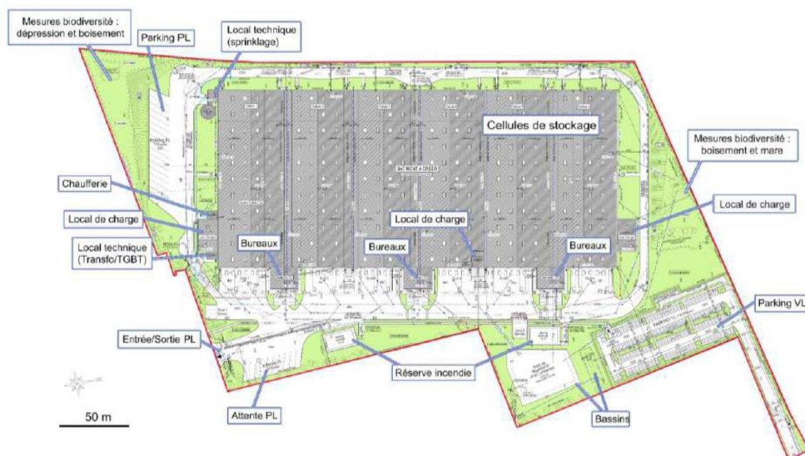
Figure 1 : Plan de masse du projet

Monsieur le Maire propose au Conseil Municipal, sur proposition de la commission Aménagement du 20 mai 2021, d'émettre l'avis favorable argumenté suivant, portant avis de la commune d'Héric sur la demande de la société SOREPRIM d'obtenir l'autorisation d'exploiter un entrepôt logistique sur le parc d'activités Erette Grand'haie à Héric :